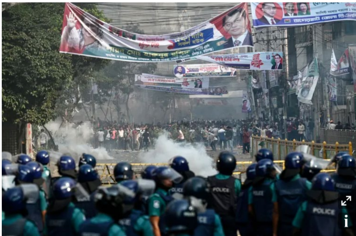
Manifestation textile à Dacca début novembre 2023

Lors de manifestations à Dacca début novembre, violemment réprimées par la police, les salariés de l'habillement du Bangladesh demandaient que le salaire minimum professionnel, gelé depuis 5 ans, soit porté à 15.000 takas par mois, soit environ 135 dollars. Finalement, il n'ont obtenu que 12.500 takas, soit 112 dollars pour 48 heures de travail par semaine. On est à des années-lumière de pays comme la France où le