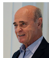
Par Jean-François Limantour Président d'Evalliance