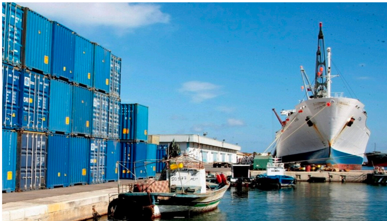
Port de Radès - Tunis

A u cours des quatre premiers mois de 2023, les exportations tunisiennes d'habillement vers l'UE ont crû de 13,6 %. Cette performance, la meilleure de celles des dix premiers fournisseurs de l'Europe, est d'autant plus remarquable que le marché européen est en baisse, marqué par une consommation vestimentaire en berne et des problèmes en cascade dans la distribution.