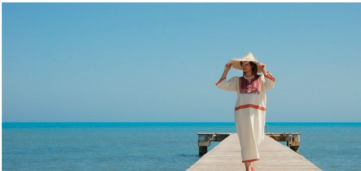
La Tunisie : Tourisme et Mode, un cocktail compétitif !